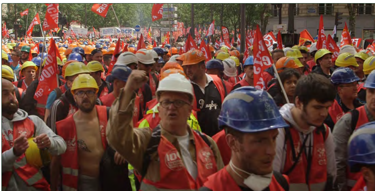
Manifestation contre la loi travail, 15 Juin 2016

Je voulais que cette histoire sonne juste, qu'elle soit directement liée à la mémoire des Havrais et que ce ne soit pas un récit historique ou de spécialiste. Il fallait que ça résonne dans le vécu des gens.