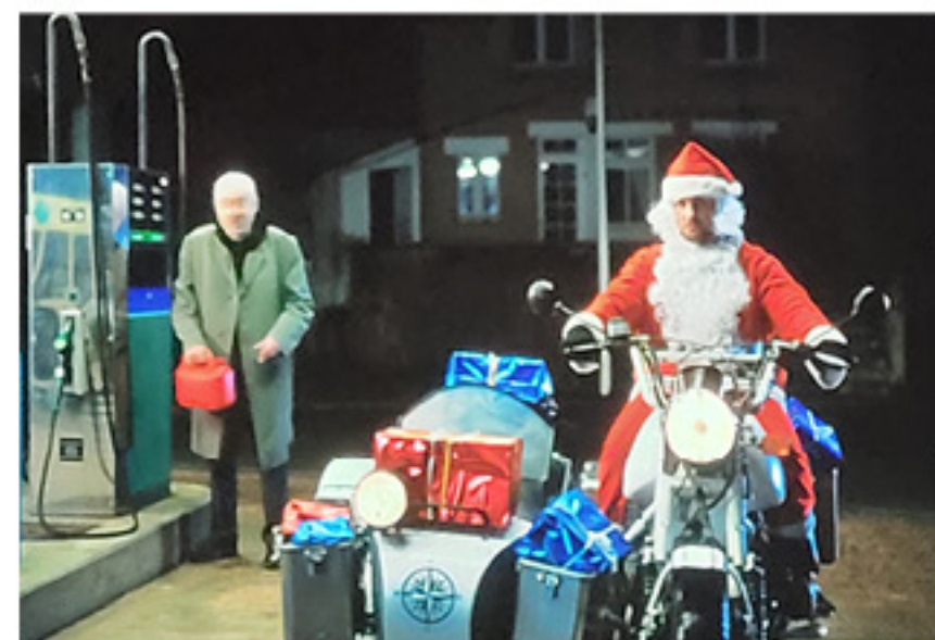
Arrêt sur image tiré du court-métrage: ici, le père de Noël et le père Noël dans une station-service.

■ La production est en discussion pour une diffusion sur des plateformes ou en avant séance comme on le faisait autrefois dans des cinémas.