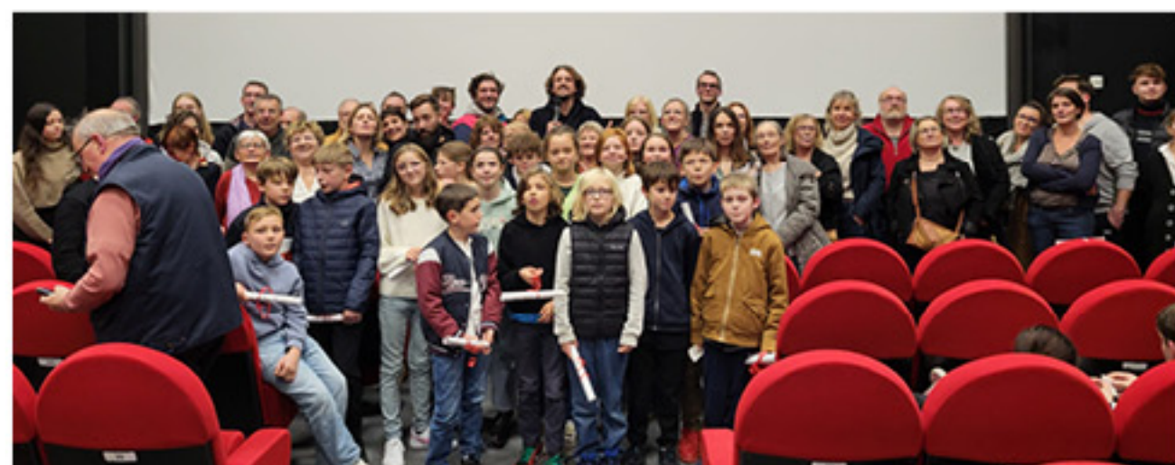
Les enfants et les figurants qui ont participé au court-métrage

Le père de Noël est un film 100 % territoire, tourné en février sur cinq jours avec 70 figurants, six acteurs professionnels et 17 enfants. Les lieux de tournage sont facilement identifiables pour les habitants de la région: le supermarché Carrefour de Saint-Georges-des-Gro-