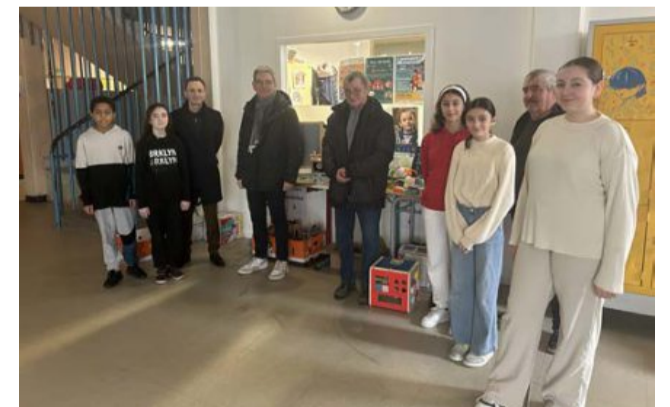
Le collège Jean-Monnet a remis les dons de la collecte de jouets au Secours populaire.

Depuis plusieurs années, le collège Jean-Monnet, en partenariat avec le Secours populaire, réalise une collecte de jeux et de jouets lors des périodes de Noël destinés aux enfants les plus démunis du secteur.