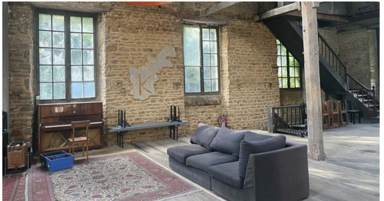
Une partie du court-métrage sera tournée au Moulin de l'Hydre, à Saint-Pierre-d'Entremont.

En coproduction avec le Moulin de l'Hydre, la société (SIC) Pictures va tourner un court-métrage dans le pays de Flers, à la fin du mois de février.