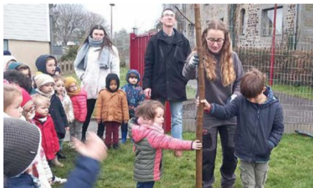
Les élèves de l'école lors de la plantation de l'arbre.

Mardi 23 janvier, les élèves de maternelle de l'école de Saint-Pierre-d'Entremont ont planté un arbre. L'action est menée dans le département par l'union nationale des entreprises du paysage (UNEP). Pour ses 60 ans d'existence, cette union propose un programme « un arbre, une école » avec 60 arbres. Une inscription sur le site a été faite par les municipalités, puis l'UNEP a contacté les entreprises retenues pour planter.