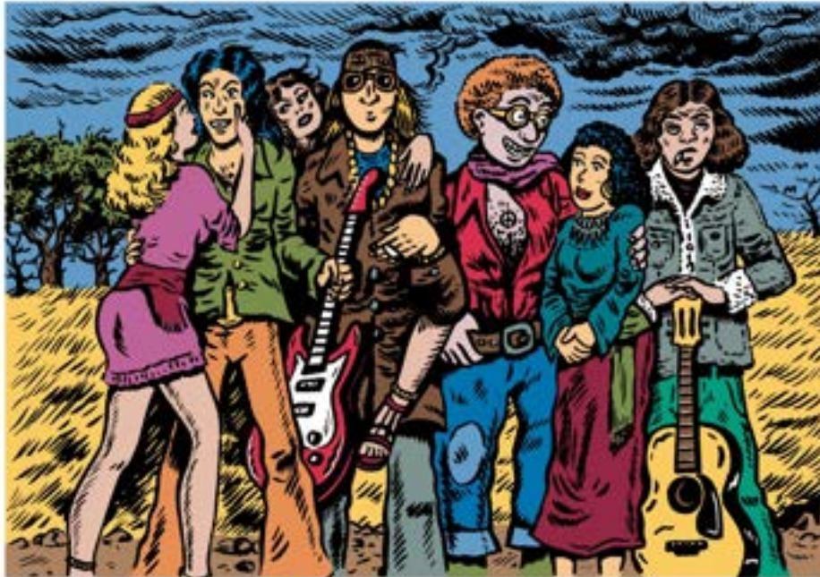
Le groupe Eruption (par le dessinateur Julien Käser)