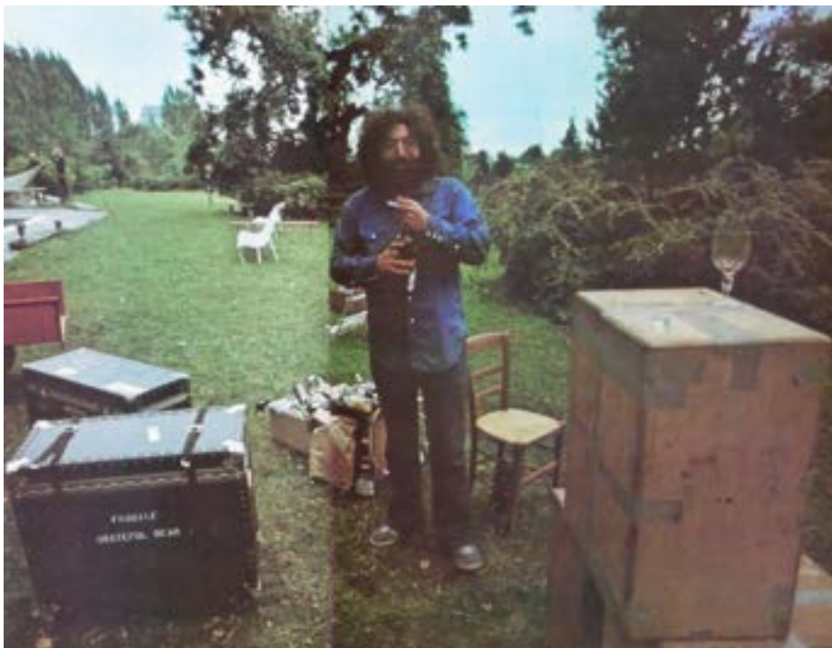
Jerry Garcia du Grateful Dead Avant le concert dans les jardins du Château d'Hérouville